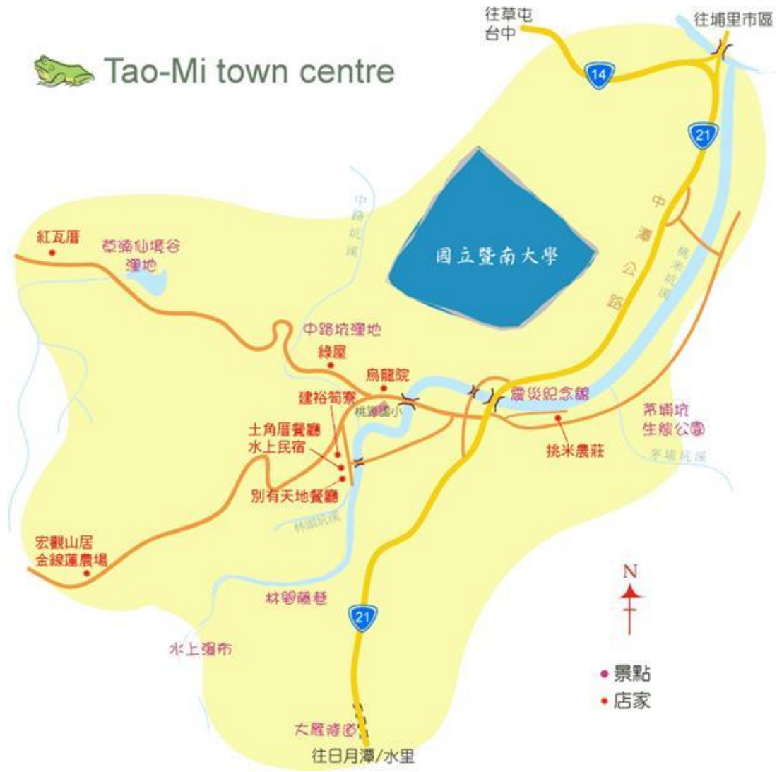
圖六 桃米社區各項聚點示意圖