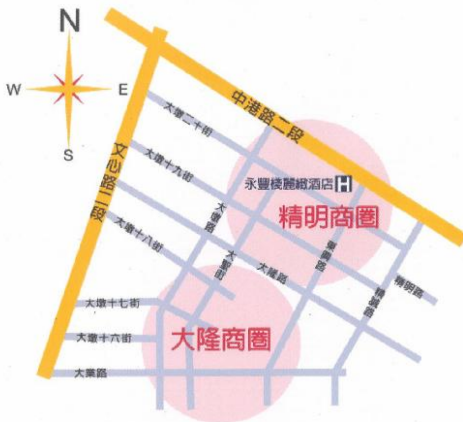
圖二 精明商圈位置圖

「精明一街」位於臺中市五期重劃區內，精明一街、精明二街與鄰近的大隆路商圈，由臺灣商務中心(TCC 辦公大樓)、麥克阿瑟大樓(住宅公寓)、富貴名廈(小坪數住宅及套房)等所組成之行人徒步商店街，它以露天歐洲情調的戶外咖啡茶座吸引了許多遊客，在在顯現了台中人生活的優雅與清閒，其蓬勃的商業活動及人潮，成為全國著名的形象商圈之一。精明一街現有40家商店，主要為露天咖啡座、精緻茶點、創意的櫥窗、流行服飾。