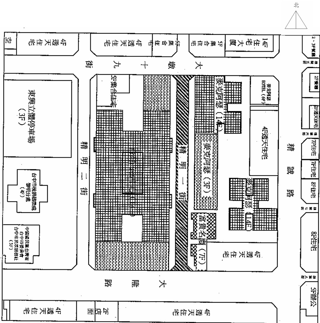
圖三 精明一街位置圖